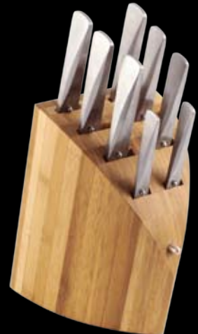
P-13 | 15 x 26 x 21 cm Messerblock aus Bambus für 8 Messer