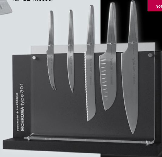
CHROMA TYPE 301 DISPLAY-02 | 44 x 30 x 11,5cm Display, magnetisch, mit Acrylbedeckung für 5 Messer