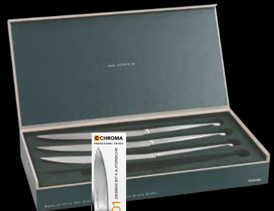
TYPE 301 Verpackung bestehend aus Kartonschuber, ansprechender Holzbox und Produktflyer