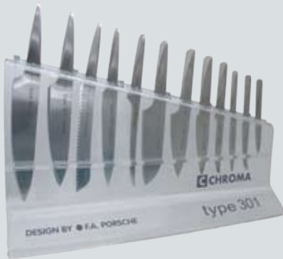
CHROMA TYPE 301 DISPLAY-12 59 x 33 x 17 cm Display aus Acryl mit Diebstahlsicherung für 12 Messer