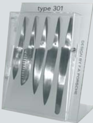
CHROMA TYPE 301 DISPLAY-08 | 34,5 x 45 x 21 cm Display aus Acryl, magnetisch, abschließbar, für 5 Messer